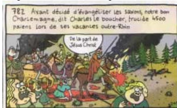
Lindingre, dans Fluide Glacial .