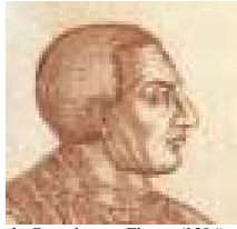
du Guesclin par Thevet (1584)